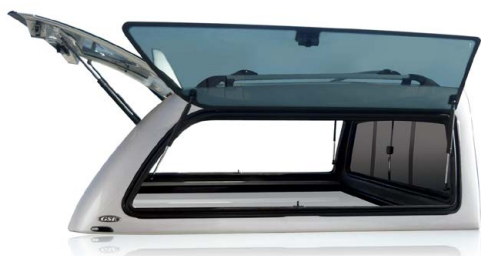
AK GSE LIFT-UP