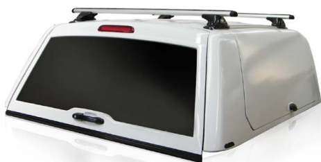
CME COMMERCIAL WORK