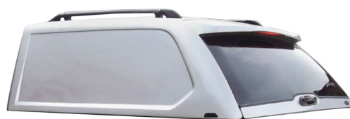
GWE COMMERCIAL WORK