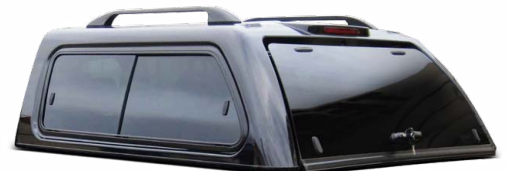
AK GTE SLIDE