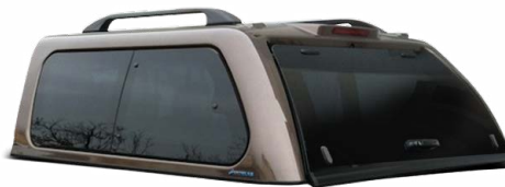
AK GSE STYLSIH