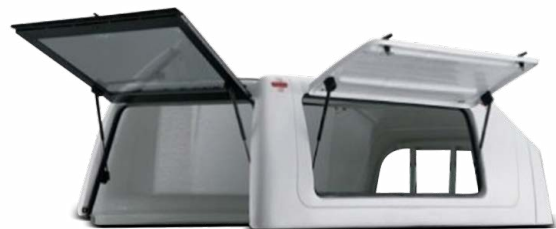
GWE ++ SUPRAINALTAT