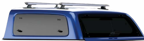
AK GSE LIFT-UP