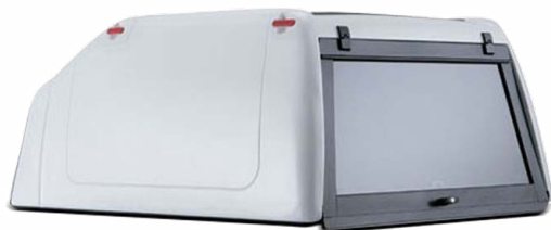
GWE ++ SUPRAINALTAT