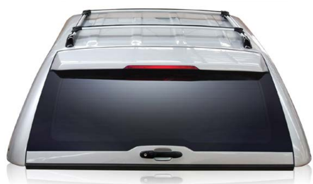
GSE DE-LUXE SPORT