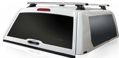
CME-W COMMERCIAL WORK