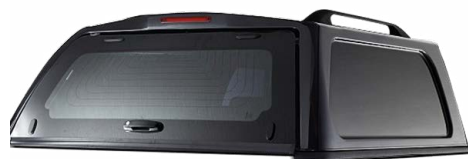
AK GWE COMERCIAL